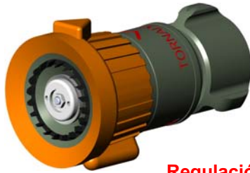
Regulación automática a 6 bar de 40 a 150 l/mn