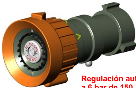
Regulación automática a 6 bar de 150 a 500 l/mn