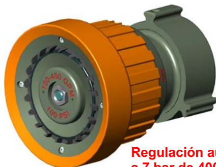
Regulación automática a 7 bar de 400 a 1000 l/mn