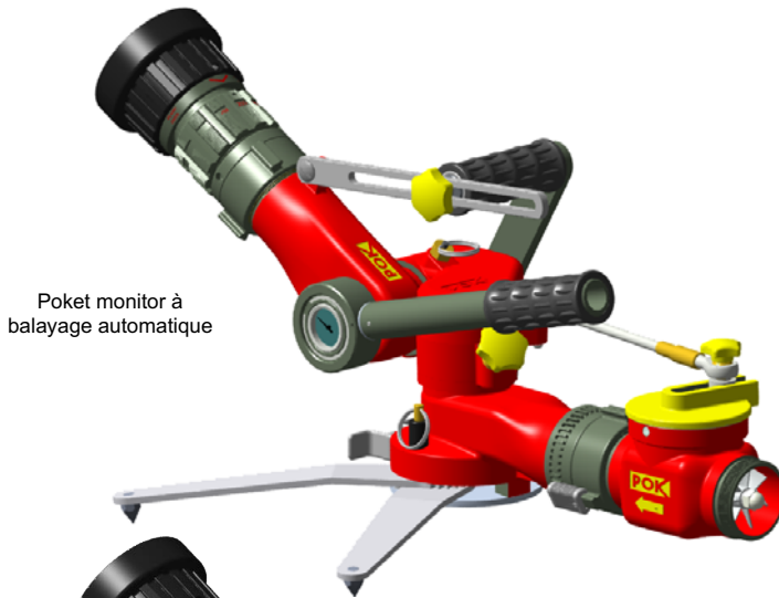
Poket monitor à balayage automatique