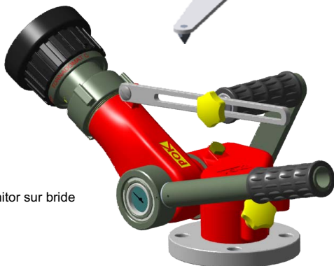
Poket monitor sur bride