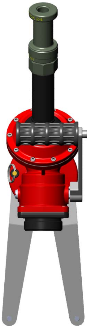
Lance monitor en position de rangement pattes stabilisatrices repliées