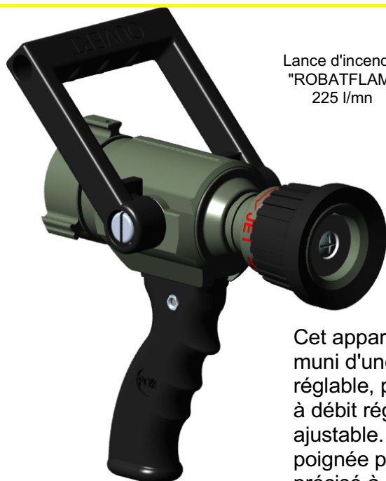
Lance d'incendie "ROBATFLAM" 225 l/mn