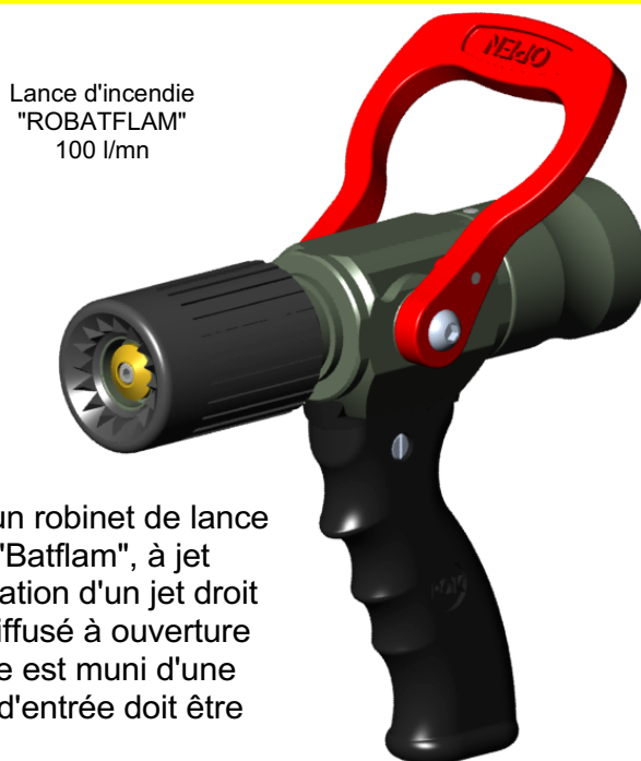
Lance d'incendie "ROBATFLAM" 100 l/mn

Cet appareil est constitué d'un robinet de lance muni d'une tête de diffusion "Batflam", à jet réglable, permettant la réalisation d'un jet droit à débit réglable ou d'un jet diffusé à ouverture ajustable. Le robinet de lance est muni d'une poignée pistolet. Le raccord d'entrée doit être précisé à la commande.