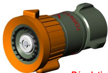
Régulation automatique à 6 bar de 40 à 150 l/mn