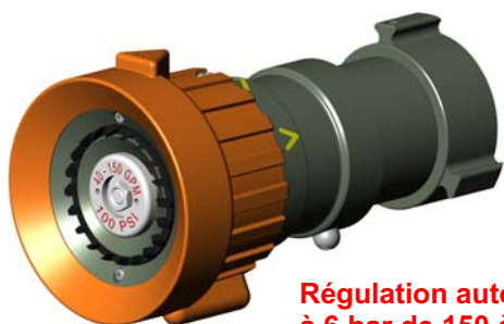
Régulation automatique à 6 bar de 150 à 500 l/mn