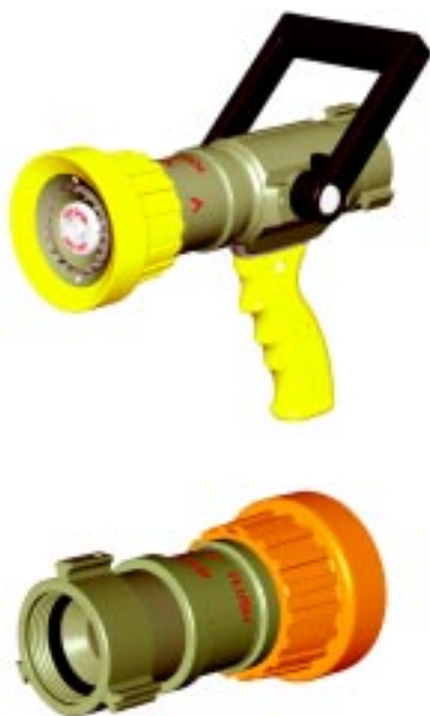
备注: 博克凯旋系列标准枪头防护套为蓝色, 另有其他颜色可供选择。

额定工作压力为双压 5 巴或 6 巴, 最大工作压力为 16 巴。可选流量范围为 150 升/分-500 升/分, 并可通过旋转枪头防护套, 实现直流、开花水流、雾状水流及枪膛高压冲洗多种喷射方式。博克所有水枪都可配合 NH, BSP, NPSH, Storz, 英制快速, 日式快速和其他特殊螺纹接口。