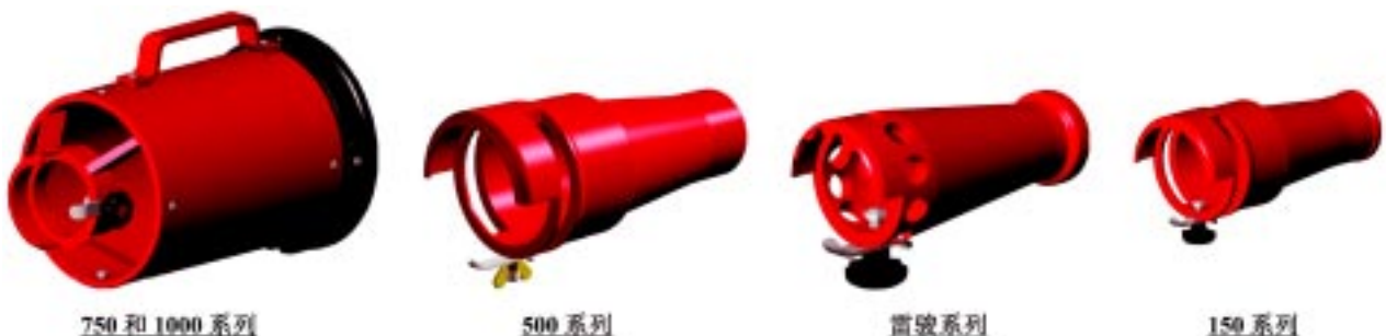
750 和 1000 系列