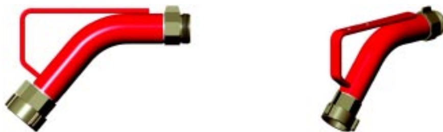
代码和型号参见 64 和 65 页

肘接口位于水枪与水带之间(可带或不带其他配件)，能够在移动作业的情况下吸收至少 15% 的水枪的反作用力。